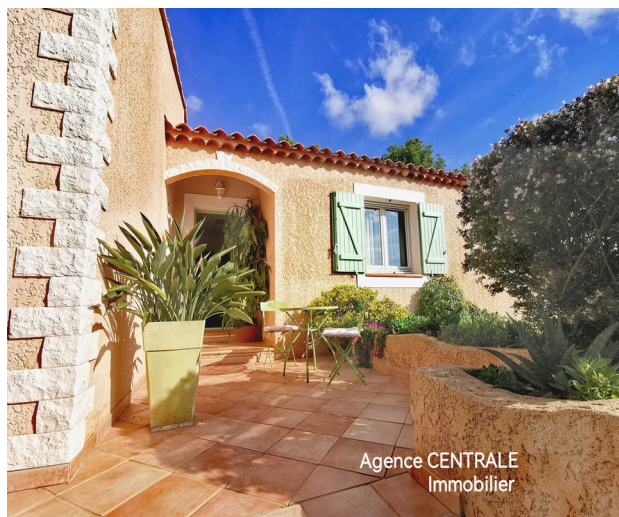
Agence CENTRALE Immobilier